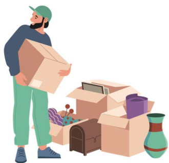
Dân tái định cư