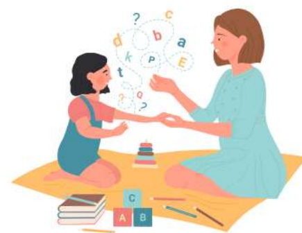
Trẻ khuyết tật