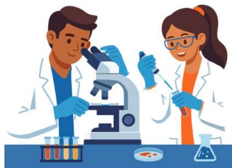
Nhà khoa học