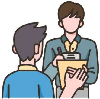
Phòng vấn xã hội học