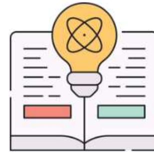
Tiêu chuẩn quy chuẩn