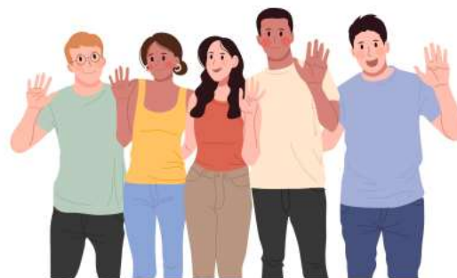
Người trẻ mới ra trường